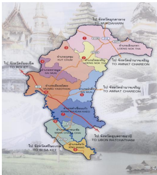
ภาพแสดงที่ตั้งและขอบเขตของจังหวัดยโสธร