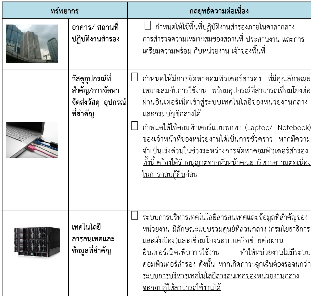
ตารางที่ 2 กลยุทธ์ความต่อเนื่อง (Business Continuity Strategy)

กลยุทธ์ความต่อเนื่อง เป็นแนวทางในการจัดทาและบริหารจัดการทรัพยากรให้มีความพร้อมเมื่อเกิดสภาวะวิกฤต ซึ่งพิจารณาทรัพยากรใน 5 ด้าน ดังตารางที่ 2